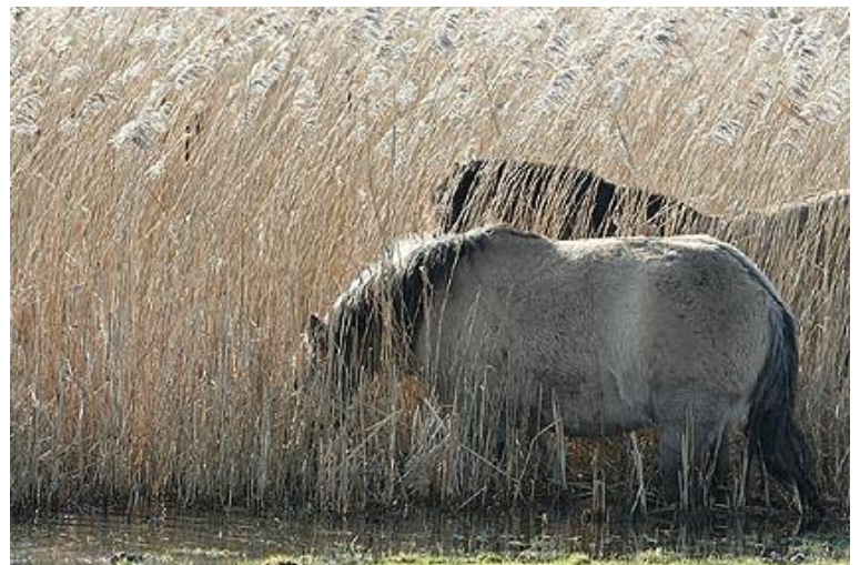
Chevaux de race KONIK