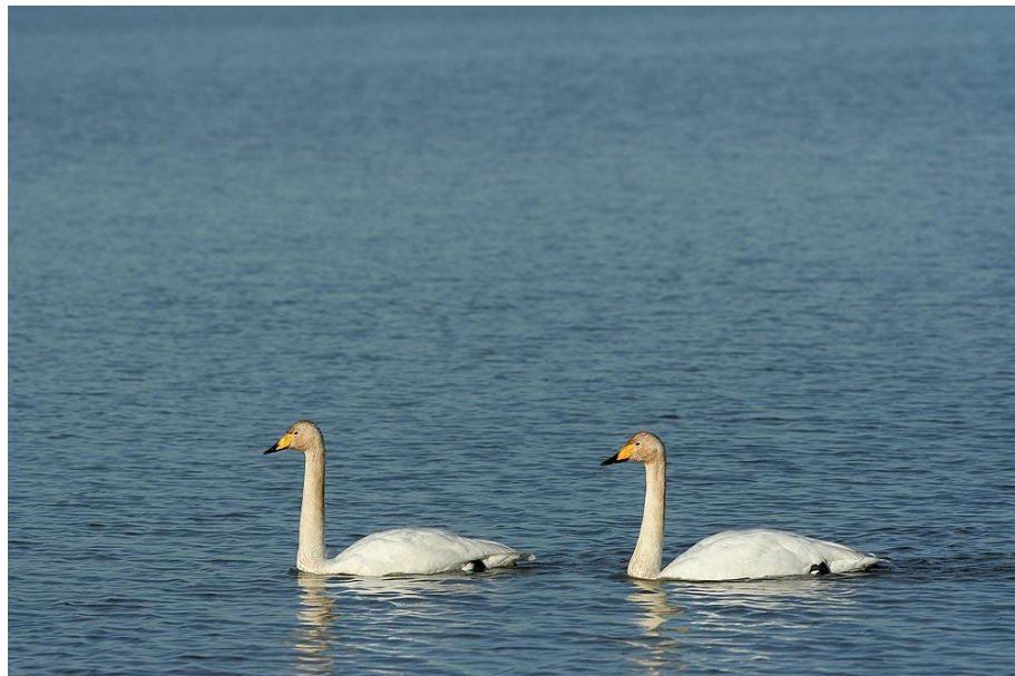
Couple de cygnes chanteur.

La réserve est fermée au public. Seule une petite zone, proche du centre d'accueil permet de se promener à pied. On peut aussi faire le tour de la réserve par la route sur digue où des points d'observations ont été installés.