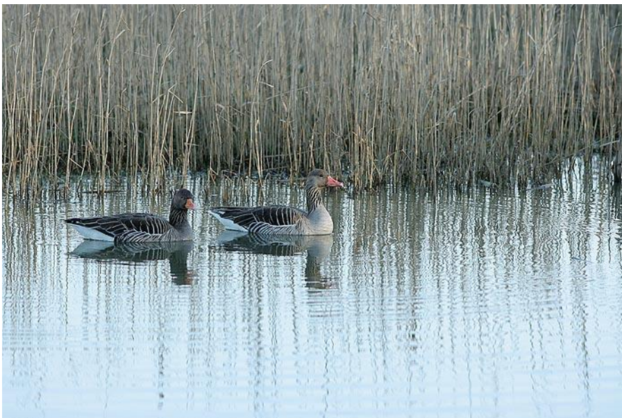
Couple d'oies cendrées