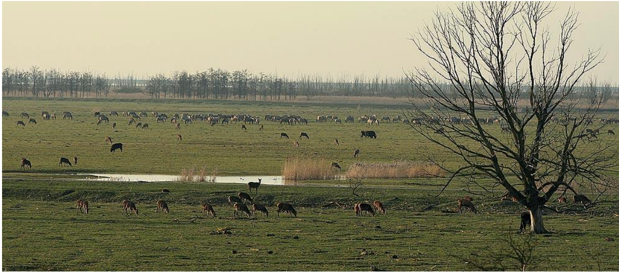
Troupeaux de chevaux, d'aurochs reconstitués, de cerfs. Un spectacle à voir