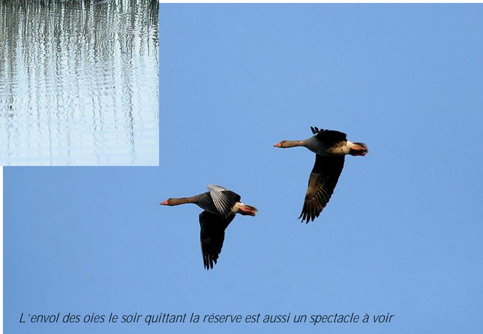
L'envol des oies le soir quittant la réserve est aussi un spectacle à voir

Il existe aussi des possibilités de visites guidées, safari photo pour de petits groupes.