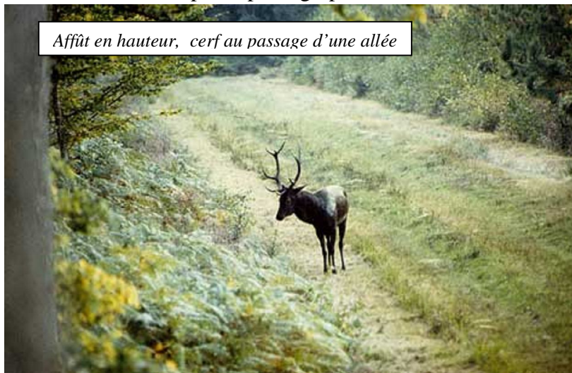
Affût en hauteur, cerf au passage d'une allée

Une autre possibilité, les affûts en hauteur. Pas tellement pratiquer par les pro de la photos qui trouvent qu'il faut être à même hauteur que son sujet, je pense qu'il constitue quand même une bonne solution pour l'amateur désireux de photographier sans déranger. En hauteur, les animaux ne sentiront pas le photographe, le bruit du boîtier les intriguera, mais il regarderont à hauteur de