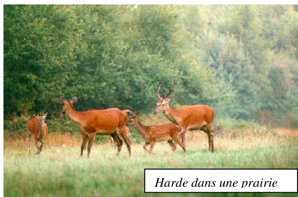
Harde dans une prairie

L'immobilité est le meilleur des camouflages. Cette façon de faire donne de bons résultats avec le chevreuil, animal casanier qui empreinte régulièrement les mêmes passages. Comme le but de l'affût est la photo, il faut penser à la lumière, est ce qu'il y en aura assez au moment tant attendu? le sujet sera t'il bien placé par rapport à celle ci? L'arrière plan est il photogénique? Moyennant ces quelques précautions, la photo ne posera pas de difficulté majeure. Le risque est de se faire repérer par le bruit du déclenchement du boîtier. Ce n'est pas dramatique, les animaux « savent » que les chemins sont aussi fréquentés par les hommes. Par contre si chaque fois qu'ils passent près de votre affût il sont inquiétés, ils finiront par ne plus passer par là . C'est une façon intéressante de ce familiariser avec la photo animalière, mais à la longue on obtient toujours le même type d'image. Plusieurs heures d'affût pour quelques secondes d'observation, c'est également frustrant.