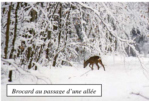
Brocard au passage d'une allée

constitueront l'affût. Veiller à être à bon vent, arriver suffisamment tôt par rapport à l'heure présumée du passage de l'animal convoité et respecter la plus grande immobilité.