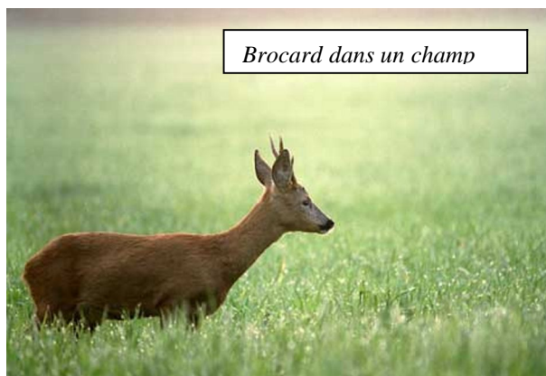
Brocard dans un champ

animaux, et ne quitter l'affût qu'à la nuit. Là aussi, il faut concilier ces impératifs avec ceux de la photo, lumière, arrière plan... Ce n'est pas toujours facile, mais le plaisir de ramener une photo d'un animal paisible dans son environnement fera oublier toutes les heures d'attentes souvent improductive.