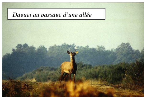
Daguet au passage d'une allée

On pourra débuter en affûtant sur une allée forestière à proximité d'une coulée. Il est bon de repérer le poste d'affût auparavant, il ne doit pas être trop près de la coulée. Les animaux étant vigilant au moment de traverser une allée, une masse suspecte trop proche les inquiétera et ils risquent de refuser de traverser. Donc pas mon plus de construction imposante, quelque fougères, des branches pour « casser » votre silhouette