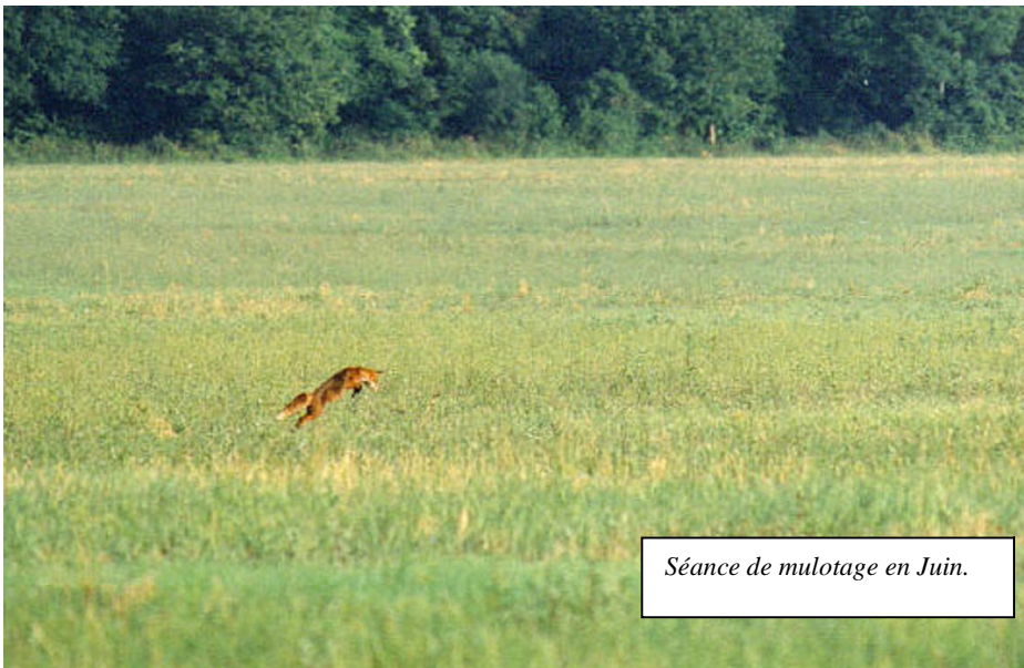
Séance de mulotage en Juin.