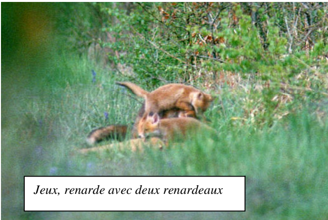
Jeux, renarde avec deux renardeaux

Dès le début du mois de juin, les renardeaux quitteront le terrier et suivront leur mère dans ses parties de chasse. On les verra assez facilement dans les prairies fraîchement fauchées en quête de nourriture, petits rongeurs,