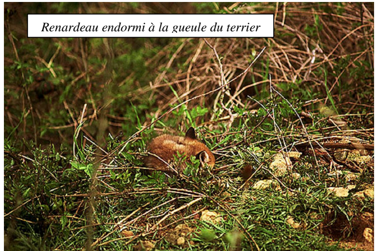
Renardeau endormi à la gueule du terrier

Dès le début du mois de juin, les renardeaux quitteront le terrier et suivront leur mère dans ses parties de chasse. On les verra assez facilement dans les prairies fraîchement fauchées en quête de nourriture, petits rongeurs,