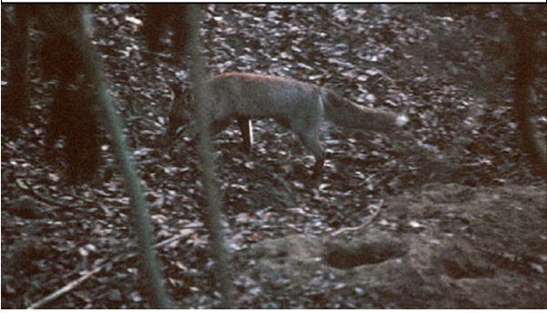
Janvier, un renard rode aux abords d'un terrier

Le rut a lieu au début de l'hiver. Bien que essentiellement nocturne, il est alors possible d'apercevoir des renards ou d'entendre des glapissements aux abords des terriers.