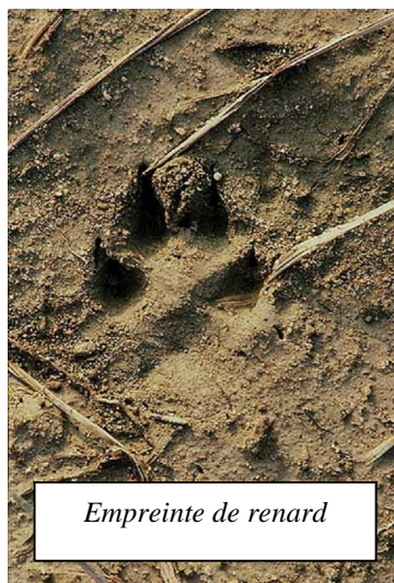
Empreinte de renard

Bien que présent dans de nombreux endroits, le renard est un animal très discret et il passe facilement inaperçu. Il n'est donc pas évident de savoir quels secteurs sont fréquentés. Les indices suivants nous y aideront :