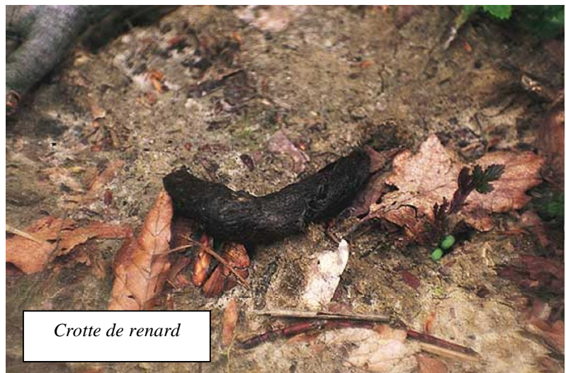
Crotte de renard

3a Les empreintes : pas toujours facile de les distinguer de celles d'un petit chien, c'est la forme et surtout la taille du coussinet plantaire qui permettra de faire la différence.