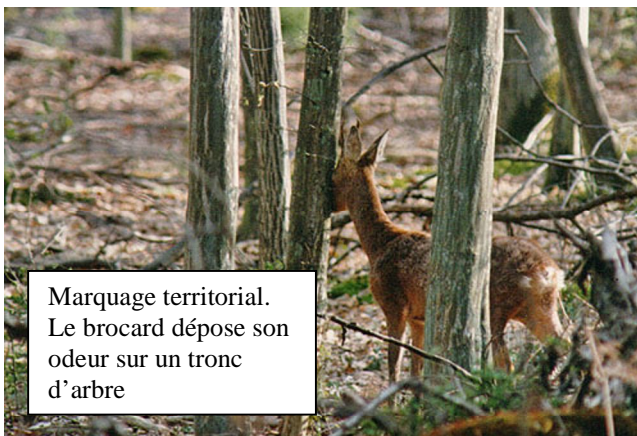
Marquage territorial. Le brocard dépose son odeur sur un tronc d'arbre